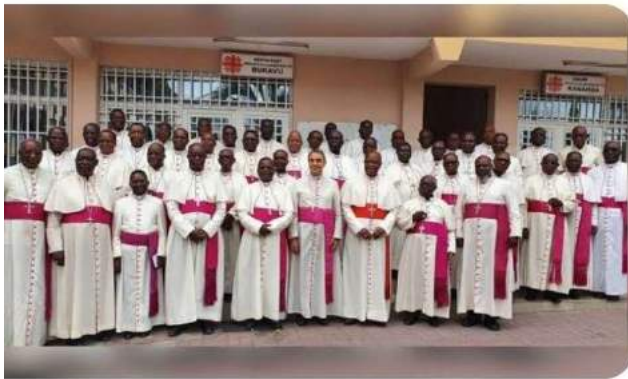
Evêques membres de la conférence épiscopale nationale congolaise

Répondant à l'appel de nos pères évêques, nous avons accepté d'organiser la marche dans notre doyenné Sainte-Marie de Kimwenza.