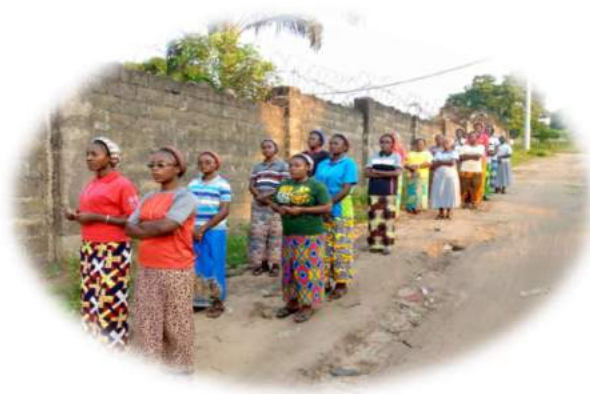
Communauté du Postulat des Sœurs Oblates de l'Assomption

Ce dernier achevé, nous avons commencé notre marche en récitant les mystères lumineux et douloureux jusqu'à la grotte du Postulat où nous avons terminé par les mystères glorieux.