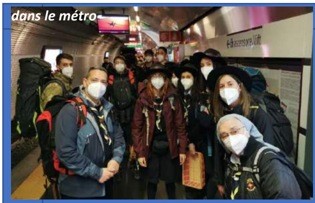
dans le métro

Je suis allée à Rome avec les « Scolte », les « Rovers » et les responsables. Nous avons fait la première partie du trajet en voiture jusqu'à la localité de Ponte Mammolo, où nous avons pris le métro pour Ottaviano. Tout s'est bien passé, même si nous avons été contrôlés par les carabinieri.