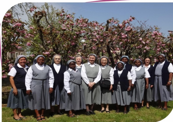
Les membres du Conseil de Congrégation – Paris, avril 2018

Du 18 avril au 2 mai 2018, nous avons eu la joie de nous retrouver en Conseil de Congrégation, à la Maison généralice. Il s'agissait de notre premier Conseil de Congrégation après le Chapitre général – des enjeux majeurs : faire le point sur les Chapitres d'application après le Chapitre général 2017 et le lancement de l'animation de notre famille religieuse pour les cinq ans à venir.