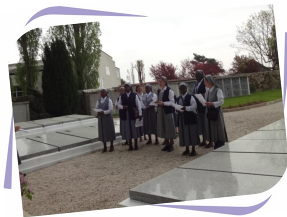
Célébration des Srs défuntes du Mesnil