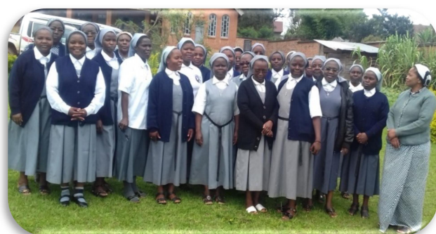
Sœurs capitulantes à Musienene du 15 au 19 octobre 2017

Dans sa lettre apostolique intitulée « debout congolais » la Conférence Episcopale Nationale du Congo (CENCO) ne cesse d'inviter le peuple à la vigilance. Ce qui suppose au préalable une information fondée. Quand on est bien informé on sait discerner en toute situation. Pour ce faire, le Chapitre provincial d'application invite tout le monde à travailler en collaboration avec d'autres associations, congrégations, confessions religieuses pour s'occuper des victimes des massacres (traumatisés, orphelins, enfants de la rue, familles disloquées...) ACA 2017 p. 23