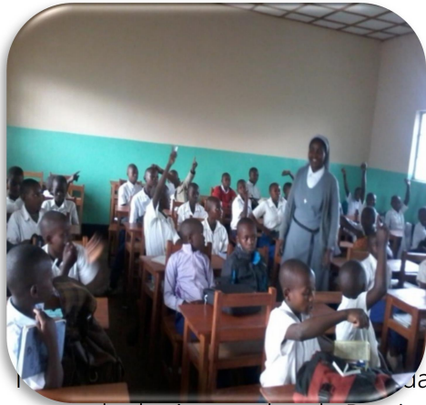
Jeunes dans pastorale des jeunes dans la Paroisse.

Venez et voyez les merveilles de Dieu à travers les belles collines, les champs de haricots et de maïs.