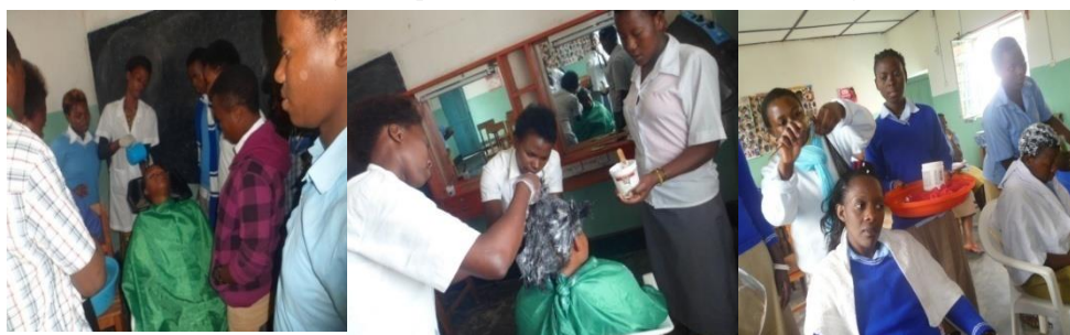
Hair dressing (Coiffure)

BUREHE VTC a pour but de combattre la pauvreté du milieu, en enseignant aux jeunes, des métiers, et en leur apprenant à élaborer de petits projets, afin qu'ils puissent utiliser leurs forces physiques en prévoyant leur avenir.