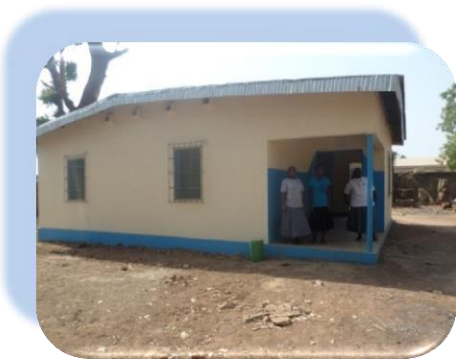
Dispensaire d'Alzon de Ferke