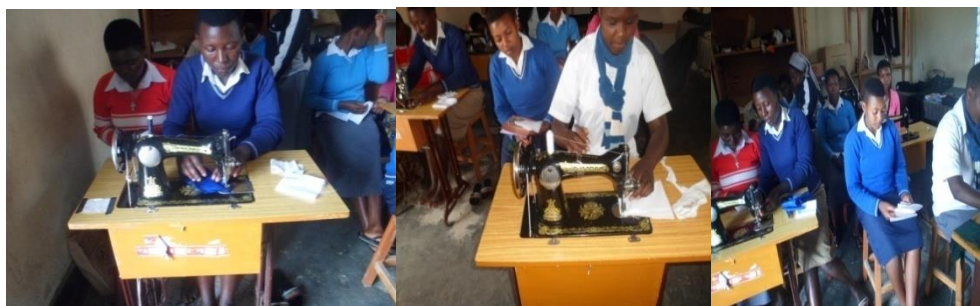
Tailoring (Coupe - Couture) Fabrication des uniformes