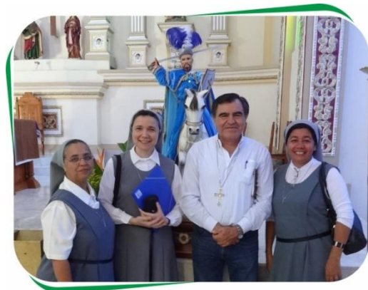
Rencontre avec l'Evêque d'Orizaba

C'est à cette occasion que les deux Congrégations Augustins et Oblates de l'Assomption seront présentées aux communautés chrétiennes locales.