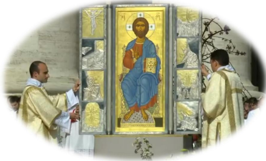
Icône Du Christ Ressuscité, Messe de Pâques, Place St-Pierre

« Nous fêtons Pâques le même jour, le 16 avril 2017 »