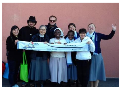
Quelques membres de la famille de l'Assomption à la clôture du Synode du diocèse de Créteil