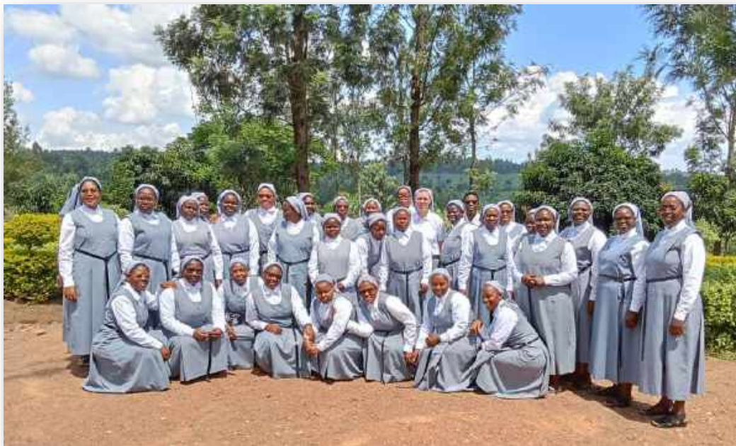
Participantes au Chapitre d'application d'Afrique de l'Est Rukomo (Rwanda) 14-19 décembre 2023