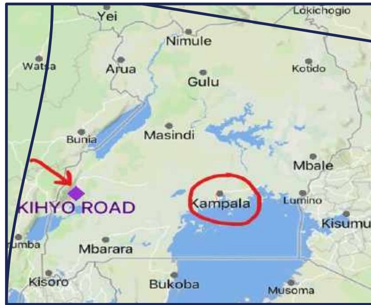
Nos Communautés en Ouganda