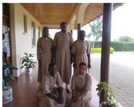
Novices Orantes de l'Assomption