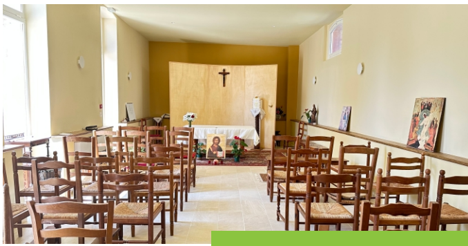
LE COEUR DE LA CHAPELLE