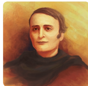
Emmanuel d'Alzon, jeune.